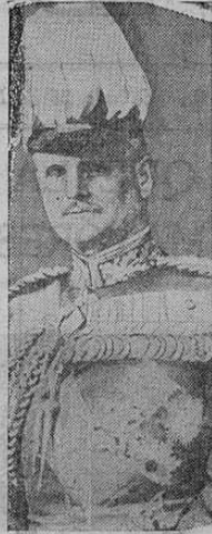
El mariscal Sir. William Riddell Birdwood se retirará en junio del cargo de comandante en jefe del ejército inglés en la India, y se dice que probablemente será nombrado gobernador general de Australia.