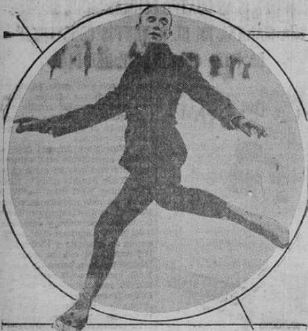
Gillis Grafstrom, sueco, es el campeón mundial en el difícil arte de patinar, y acaba de llegar a Nueva York para defender su título en un concurso