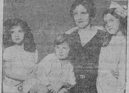
La señora e hijos de Mr. Patrick J. Hurley, recientemente nombrado secretario de guerra por el presidente Hoover