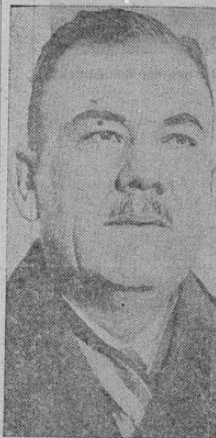
La foto muestra al ex-presidente de México, general Calles, a su llegada a Nueva York, después de una permanencia en Europa