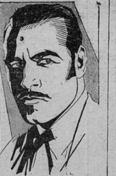
JACK HOLT IN "AVALANCHA" A PARAMOUNT PICTURE

Sensacional Estreno a las 8.30 de la noche Aventuras — Peleas — Emoción La electrizante película PARAMOUNT