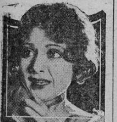
FLORENCE ALLEN in a scene from "THE FACE OF SCOTLANDYARD" A UNIVERSAL CHAPTER PLAY

El misterio más impenetrable y la más diabólica trama sensacional. Estreno de los episodios: 1o. Una sortija Fatal. 2o. Un grito en la noche. 3o. La Mazmorra Fatal. 4o. Los antros de Lime House.