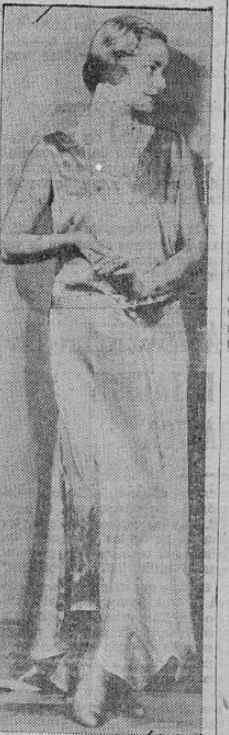
Este precioso modelo de terciopelo verde transparente es especial para un cuerpo esbelto y elegante