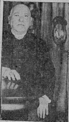
La foto muestra al cardenal O'Connell, de Boston, dirigiendo un saludo a sus fieles por medio del radio