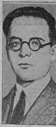
Marcelo Ariand acaba de obtener el premio Gouncourt con su obra "L'Ordre"