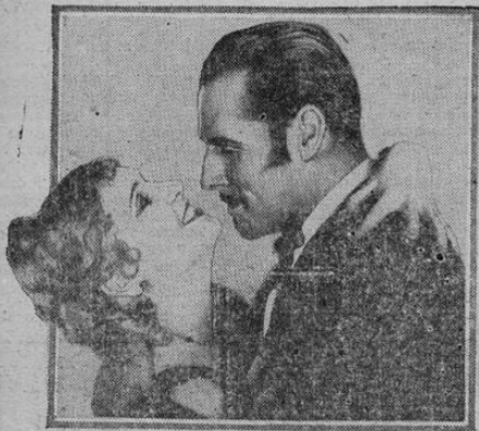
BAKLANOVA WITH JACK HOLT IN "AVALANCHA" A PARAMOUNT PICTURE

Otra de esas electrizantes películas debido al ingenio del gran autor Zane Grey estrena esta noche a las ocho y media p. m. en el Teatro Raventos. La sensacional película titulada AVALANCHA o LA GARRA DE LOS CELOS en donde actúa el más intrépido y valeroso de los artistas de ese género el apuesto JACK HOLT . El San José hay un gran público a quien le satisface estas películas de emocionantes luchas